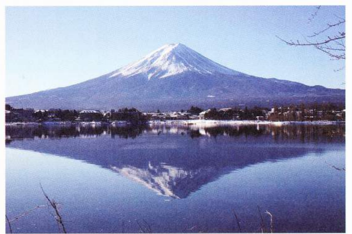
富士河口湖町大石公園