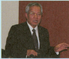
昭和21年9月15日生まれ。 昭和46年長崎大学医学部卒業。 長崎大学脳神経外科助手、米国ロマリタ大学留学経験後、昭和56年に国立長崎中央病院脳神経外科に入局。救命救急センター主幹、診療部長、副院長を経て、平成14年院長就任。平成24年退職。平成24年長崎県病院企業団企業長に就任し、現在は長崎の離島医療を運営管理している。

この旅は、私が若い頃から憧れているシルクロードのほんの始まりです。中央アジアで最も美しい都市（私は、若い頃からそう信じ込んでいる）サマルカンドへの旅の始まりと信じ、夢を膨らませている所です。