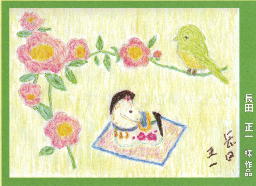
長田 正一 様 作品